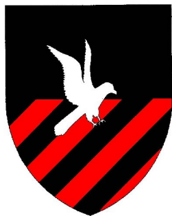
Rabe 423 n.P.